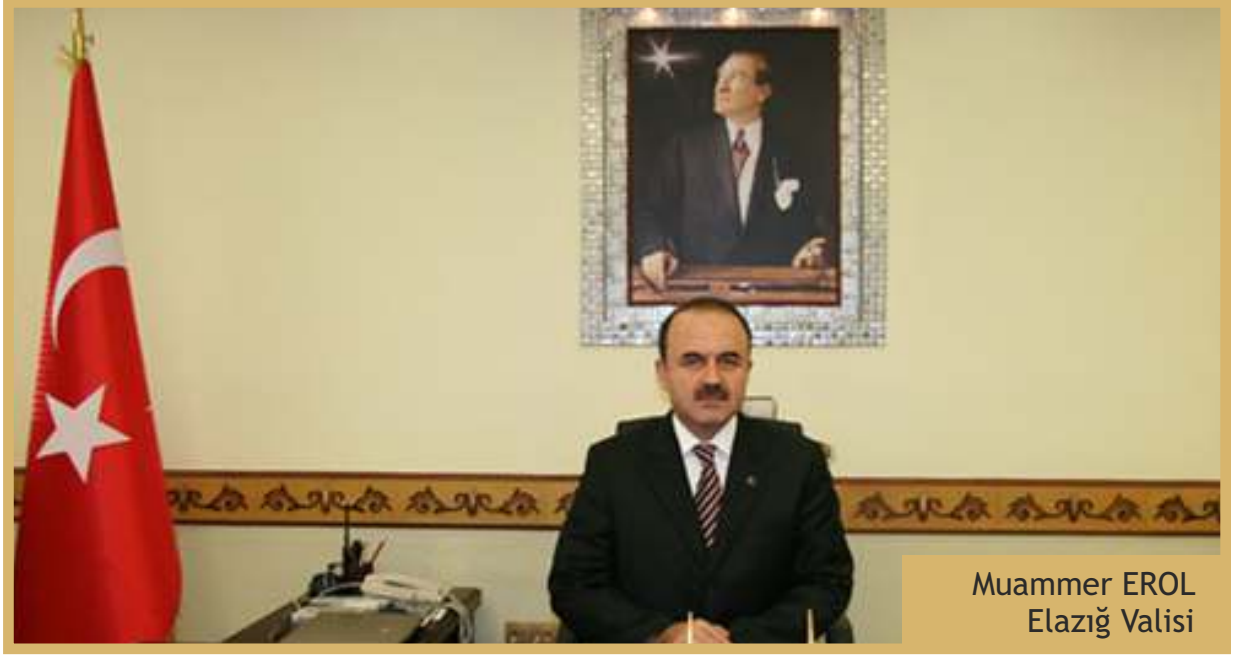
Muammer EROL Elazığ Valisi

Kalkınma Planları ve Programlarında yer alan politika ve hedefler doğrultusunda, kamu kaynaklarının etkili, ekonomik ve verimli bir şekilde kullanılması, hesap verebilirlik için; kamu mali yönetiminin yapısı ve işleyişi, kamu bütçelerinin hazırlanması, uygulanması, tüm mali işlemlerin muhasebeleştirilmesi, raporlanması ve mali kontrolünü sağlamak Kamu Mali Yönetimi ve Kontrol Kanununun temel amaçlarından biridir.