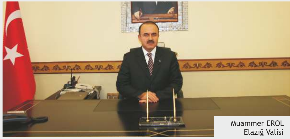
Muammer EROL Elazığ Valisi

5018 sayılı Kamu Mali Yönetimi ve Kontrol Kanunu ile; Kalkınma Planları ve Programlarında yer alan politika ve hedefler doğrultusunda, kamu kaynaklarının etkili, ekonomik ve verimli bir şekilde üretilmesi, kullanılması, hesap verebilirlik ve mali saydamlığı sağlamak için; kamu mali yönetiminin yapısı ve işleyişi, kamu bütçelerinin hazırlanması, uygulanması, tüm mali işlemlerin muhasebeleştirilmesi, raporlanması ve mali kontrolünü sağlamak amaçlanmaktadır.